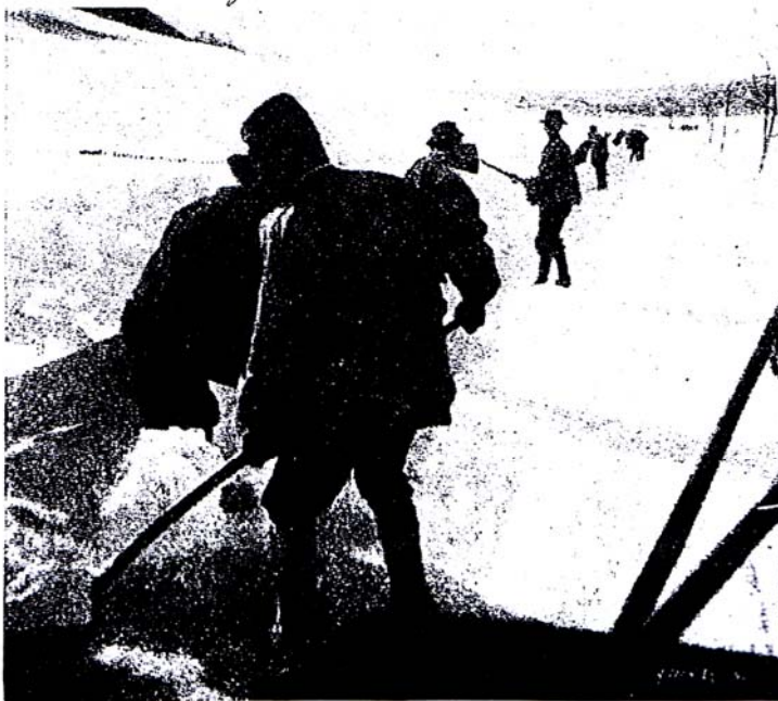
Le déblaiement des routes en hiver pres de l'A Dombrea 1897, p. 90

Moi soussigné confesse d'avoir reçu des différents Bourgeois de la Commune de St. Abbaye, en différentes époques l'entier payement des différents Ouvrages, en tailles et maçonnerie pour la construction du Pont d'embar sur la Lionne, et la chaudière en taille, Dessus du village de St. Abbaye, s'élevant le tout à la somme de quatre cent cinquante sept francs, selon le compte que j'en ai fait à la Municipalité de St. Abbaye soussigné du 6 e Xbre 1803.