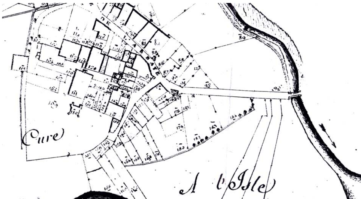
Cadastre de 1814. Le nouveau pont de la Lionne existe désormais depuis une quinzaine d'années et est constitué par un ouvrage d'art solide et destiné à braver les siècles. Ce qui fut, puisqu'on le trouve toujours vaillant de nos jours. Un témoignage irremplaçable de la bienfaisance de nos anciens tailleurs de pierre, grands maîtres en leur difficile métier.