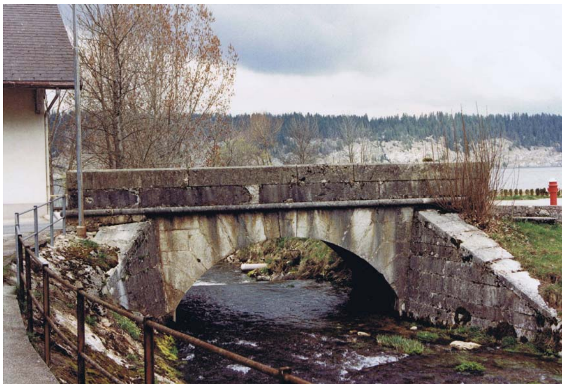
Pont de la Lionne en 1993.