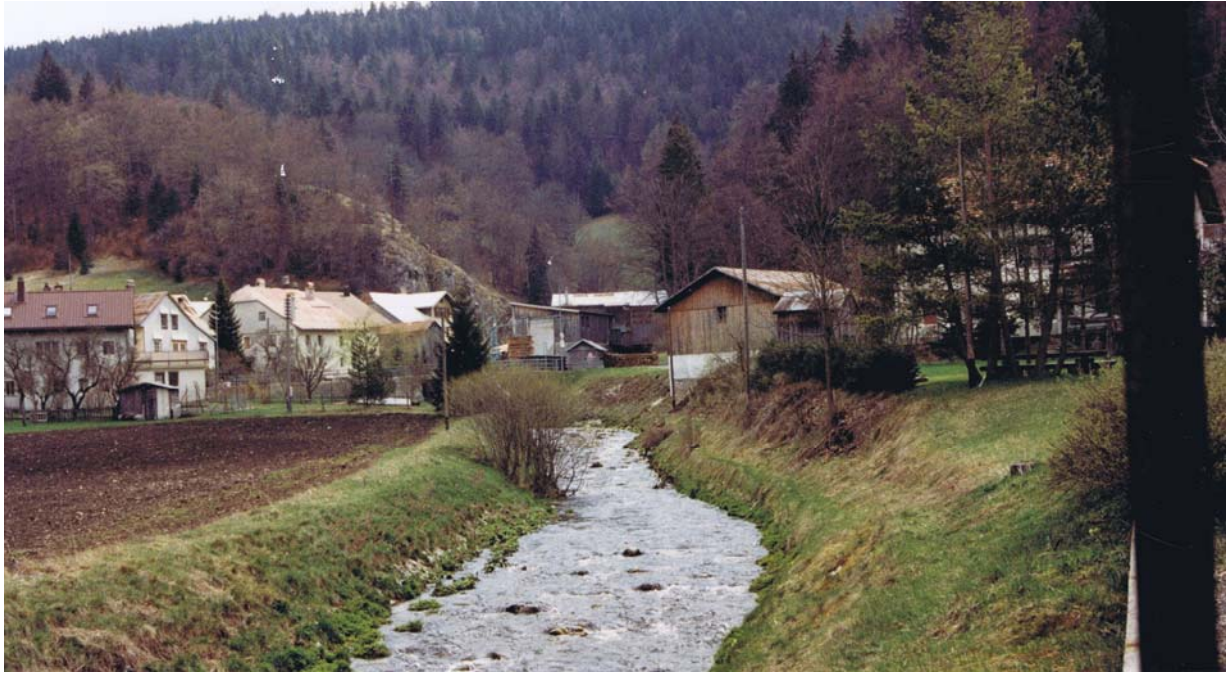
La Lionne vue en direction amont. Des travaux d'endiguement en même temps que de redressement de la rivière ont du avoir lieu en différentes époques, notamment en 1798, alors que l'on construisait le pont de la Lionne en pierre.